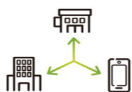
販売チャネル選定