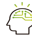
デザイン開発支援

市場・顧客・自社・競合などの環境分析をふまえて、競争優位性や最適な市場・販売手法・価格の設定といった戦略立案から実行支援までをおこないます。